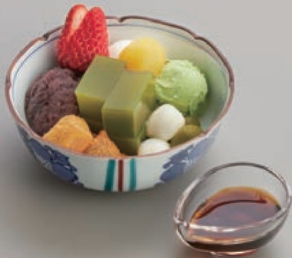
抹茶と小倉のあんみつ 780円(税込)

砂川で長年愛される、岩瀬牧場の搾りたてミルクとストロベリーミルクフィューのジェラートが魅力のパフェ。