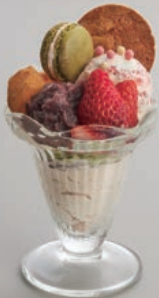
搾りたてミルクのジェラートパフェ 1,100円(税込)

砂川で長年愛される、岩瀬牧場の搾りたてミルクとストロベリーミルクフィューのジェラートが魅力のパフェ。